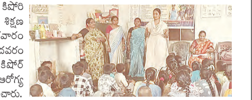
బనగానపల్లె, మే 8, ప్రభాతవార్త : కిషోరి వికాసం వేసవి సెలవుల శిక్షణ కార్యక్రమంలో భాగంగా శుక్రవారం బనగానపల్లె మండలంలోని నందవరం గ్రామ అంగన్వాడీ కేంద్రంలో కిషోరి బాలికలకు ప్రత్యేక శిక్షణ మరియు ఆరోగ్య అవగాహన కార్యక్రమం నిర్వహించారు.