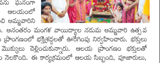
బనగానపల్లె, మే 8, ప్రభాతవార్త : బనగానపల్లె మండలంలోని నందవరం గ్రామంలో వెలసిన శ్రీ చౌడేశ్వరి అమ్మవారి దేవస్థానంలో శుక్రవారం సందర్భంగా అమ్మవారి పుట్టి నేమను ఘనంగా నిర్వహించారు.

బనగానపల్లె, మే 8, ప్రభాతవార్త : బనగానపల్లె మండలంలోని నందవరం గ్రామంలో వెలసిన శ్రీ చౌడేశ్వరి అమ్మవారి దేవస్థానంలో శుక్రవారం సందర్భంగా అమ్మవారి పుట్టి నేమను ఘనంగా నిర్వహించారు. ఈ సందర్భంగా ఆలయంలో ప్రత్యేక పూజలు, అర్చనలు నిర్వహించి అమ్మవారిని పుచ్చాల్తో అందంగా అలంకరించారు. అనంతరం మంగళ వాయిద్యాల నడుమ అమ్మవారి ఉత్సవ పుష్పాన్ని పుట్టిలో ప్రతిబింబి అలయ ప్రాంగణంలో భక్తిభక్తలతో ఊరేగింపు నిర్వహించారు. భక్తులు అమ్మవారిని దర్శించుకుని ప్రత్యేక మొక్కులు చెల్లించుకున్నారు. ఆలయ ప్రాంగణం భక్తులతో కిక్కిరిసిపోయి ఆధ్యాత్మిక వాతావరణం లభించింది. ఈ కార్యక్రమంలో ఆలయ సిబ్బంది, పూజారులు, గ్రామస్థులు మరియు బహుళ సంఖ్యలో భక్తులు పాల్గొన్నారు.