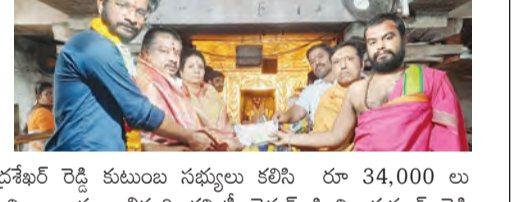
బనగానపల్లె, మే 8, ప్రభాతవార్త : బనగానపల్లె మండలంలోని నందవరం గ్రామంలో వెలసిన శ్రీ చౌడేశ్వరి అమ్మవారి దేవస్థానంలో శుక్రవారం సందర్భంగా అమ్మవారి పుట్టి నేమను ఘనంగా నిర్వహించారు. ఈ సందర్భంగా ఆలయంలో ప్రత్యేక పూజలు, అర్చనలు నిర్వహించి అమ్మవారిని పుచ్చాల్తో అందంగా అలంకరించారు. అనంతరం మంగళ వాయిద్యాల నడుమ అమ్మవారి ఉత్సవ పుష్పాన్ని పుట్టిలో ప్రతిబింబి అలయ ప్రాంగణంలో భక్తిభక్తలతో ఊరేగింపు నిర్వహించారు. భక్తులు అమ్మవారిని దర్శించుకుని ప్రత్యేక మొక్కులు చెల్లించుకున్నారు. ఆలయ ప్రాంగణం భక్తులతో కిక్కిరిసిపోయి ఆధ్యాత్మిక వాతావరణం లభించింది. ఈ కార్యక్రమంలో ఆలయ సిబ్బంది, పూజారులు, గ్రామస్థులు మరియు బహుళ సంఖ్యలో భక్తులు పాల్గొన్నారు.