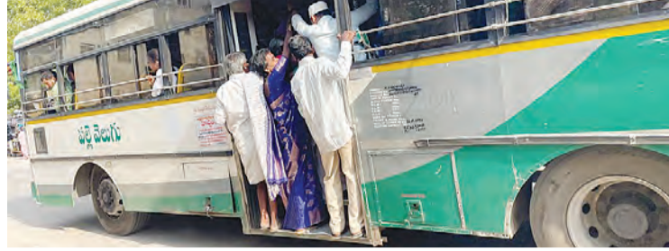
రద్దీ కారణంగా పుట్టి బోర్డు పై నిలబడి ప్రయాణిస్తున్న ప్రయాణికులు

గోనగండ్ల, మే 8, ప్రభాతవార్త : పెళ్లిళ్ల మానం కావడం, అందులోనే వేసవి సెలవులు, డీసీ తోడు మహిళలకు ఉచిత బస్సు ప్రయాణం దీంతో ప్రయాణాల జోరు పెరిగింది. ప్రయాణికులు సంఖ్య పెరిగినప్పటికీ అధికారులు మాత్రం బస్సులు సంఖ్యను పెంచలేదు. ఈ కారణంగా వచ్చిన బస్సులోనే ప్రయాణం చేయాలి. కావున ప్రయాణికులు కూర్చోవడానికి సీట్లు అటువంటి నిలబడడానికి బోలు ఉంటే చాలా అస్వస్థులు తయారైంది. శుక్రవారం గోనగండ్లలో ఏకంగా ప్రయాణికులు పుట్టిబోర్డు పై నిలబడి పల్లెవెలుగు బస్సులో కర్నూలుకు ప్రయాణం చేస్తున్నారు. ఏమాత్రం అదుపు తప్పితే ప్రాణాలకు ప్రమాదమే. అయితే ప్రయాణికులకు సరిపడ బస్సులను మాత్రమే అరేబీసీ సంస్థ పెంచడం పోవడంతో ఉన్న బస్సులలోనే ఇబ్బంది పడుతున్న ప్రయాణికులు చేయాలి. ప్రతి దినం కర్నూలు, కోడుమూరు, గోనగండ్ల, ఎమ్మిగనూరు, ఆదోని రూల్ రద్దీ గ్రామాలకు ఉంటుంది. డీసీ తోడు పెళ్లిళ్లు ఎక్కువగా ఉంటే మాత్రం బస్సులు రద్దీ ఇంకా అంతాకాదు. కావున అరేబీసీ అధికారులు ప్రయాణికుల సౌకర్యం కోసం రద్దీని బట్టి బస్సులను పెంచాలని ప్రజలు కోరుతున్నారు.